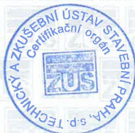
Razítko certifikačního orgánu

Tato příloha je nedílnou součástí certifikátu č. 070-064646.